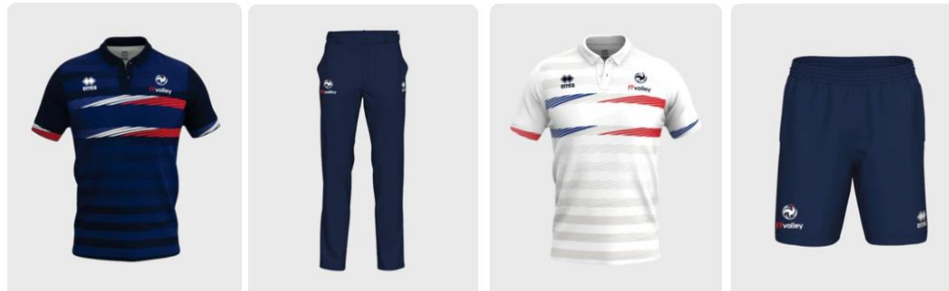
Polo Arbitre 2 Fédération de Volley 25/26 Marine Royal Rouge 70,40 €

Merci aux clubs de bien vouloir équiper vos marqueurs et arbitres pour la saison 2025-2026 et les suivantes.