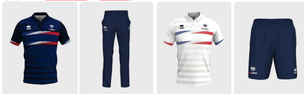
Polo Arbitre 2 Fédération de Volley 25/26 Marine Royal Rouge 70,40 €

Merci aux clubs de bien vouloir équiper vos marqueurs et arbitres pour la saison 2025-2026 et les suivantes.